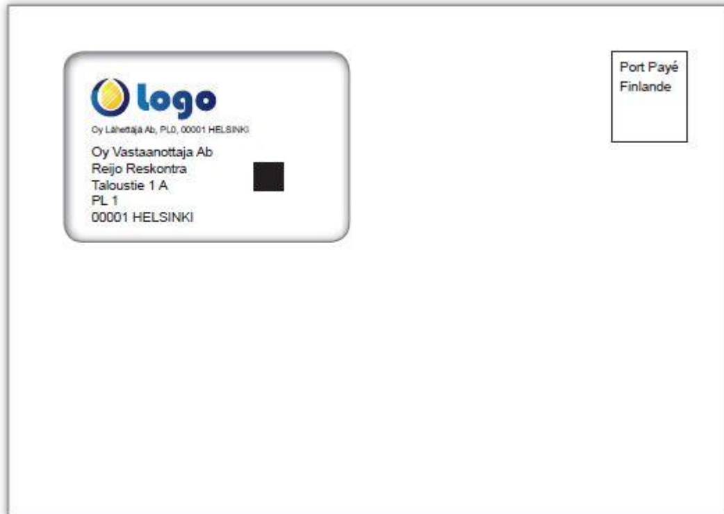
Kuva 2. We Mail C5-kuori

Konekuoritettavia, ikkunallisia kirjekuoria on kahta kokoa: C5 ja C4. Ikkunan koko on 90 x 70 mm (ikkunan vasen yläkulma on 15 mm kuoren yläreunasta ja 18 mm kuoren vasemmasta reunasta). Kuoren sisäpuoli on tietoturvapainatettu estämään kirjeen sisältöä näkymästä kuoren läpi.